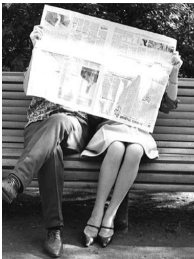
Редакция газеты «Выбор».

По итогам предпочтений журналистской комиссии будут определены лидеры. Награждение пройдёт во второй половине июня. Фото и рассказы мы напечатаем в нашей газете.