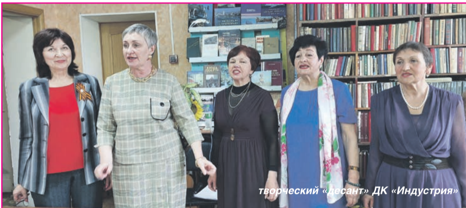
творческий «десант» ДК «Индустрия»