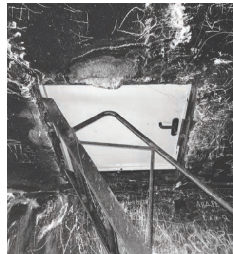
Противопожарный люк, ключа от которого ни у кого нет

эвакуации. Коридоры второго и третьего этажей вообще оказались перегорожены железными дверями, которые в какой-то степени спасали находящиеся за ними квартиры от заполнившего дом дыма, но перекрыли пожарным возможность свободного перемещения на четвертый и пятый этажи, оставив свободным движение только по одному лестничному маршу.