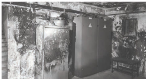
Новый электрощит вместо пострадавшего уже установили. Скоро, видимо, появятся диван и стол для посиделок