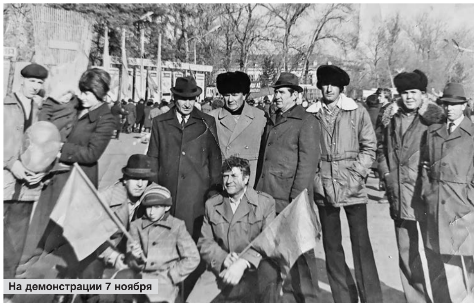
На демонстрации 7 ноября