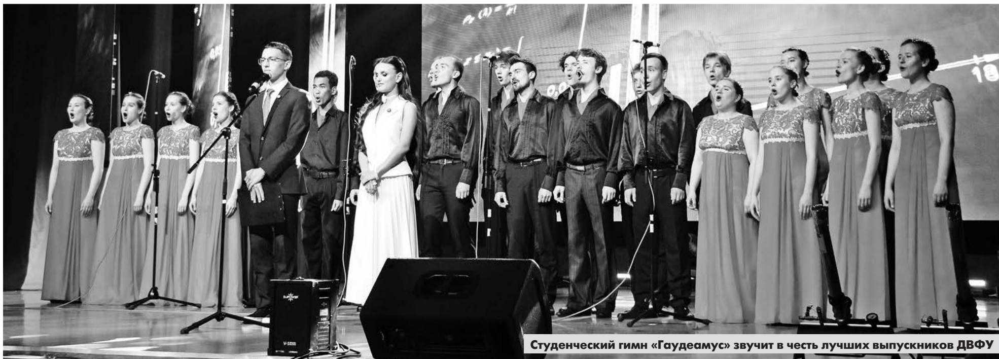
Студенческий гимн «Гаудеамус» звучит в честь лучших выпускников ДВФУ

Подготовил Дмитрий ПОДОЛЬСКИЙ, фото автора.