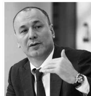
Анзор Ахмедович Музаев – российский государственный деятель. Руководитель Федеральной службы по надзору в сфере образования и науки (Рособрнадзор) с 18 августа 2020 года.

Глава Рособрнадзора Анзор Музаев заявляет, что отмена ЕГЭ невозможна до появления более жизнеспособной альтернативы. Он также отметил, что выпускники никогда не согласятся на возврат к старой системе оценивания. Ведь она не подразумевает никаких демоверсий экзаменов и возможности подачи документов одновременно в пять вузов. «Без ЕГЭ в университеты будет