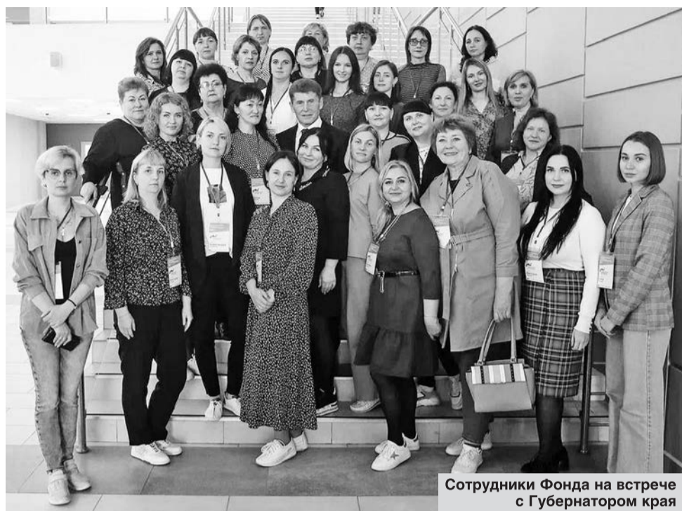
Сотрудники Фонда на встрече с Губернатором края

За счёт государственной и муниципальной поддержки демобилизованным участникам боевых действий и их семьям