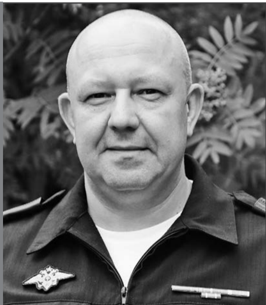
Игорь Дмитриевич РОНЖИН, подполковник полиции, заместитель начальника полиции по охране общественного порядка ОМВД России по г. Артему.

ЛАУРЕАТ ПРЕМИИ ГОДА СРЕДИ РАБОТНИКОВ ПРАВООХРАНИТЕЛЬНЫХ ОРГАНОВ