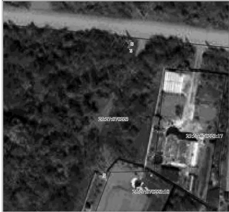
План границ объекта