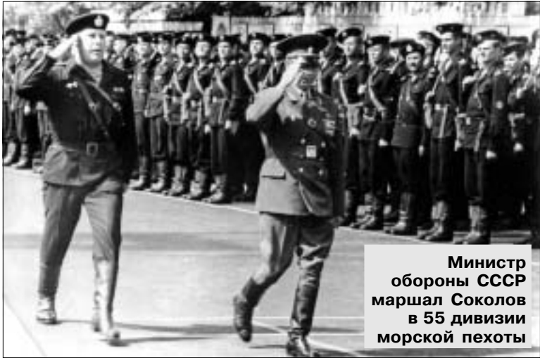
Министр обороны СССР маршал Соколов в 55 дивизии морской пехоты

Причиной зарождения морской пехоты явилась необходимость защиты рубежей России, а также морские походы и борьба нашего государства за выход к морю.