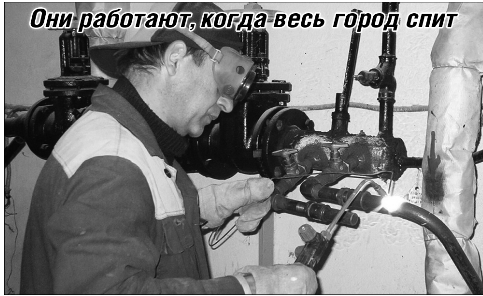
Они работают, когда весь город спит