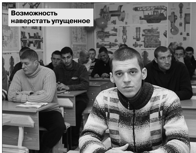
Возможность наверстать упущенное

Семейных, работающих и воспитывающих собственных детей взрослых людей привлекает в вечерней школе ре-