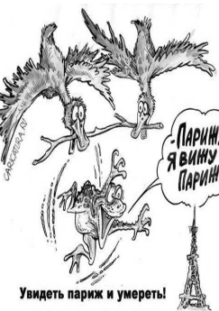
Увидеть париж и умереть!

- Не беда, - утешает ее муж. - Чем дольше мы тут будем сидеть, тем древнее будет Колизей, когда мы придем на него посмотреть.