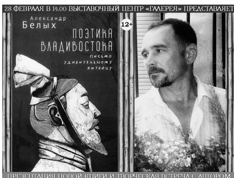
ПРЕЗЕНТАЦИЯ НОВОЙ КНИГИ И ТВОРЧЕСКАЯ ВСТРЕЧА С АВТОРОМ