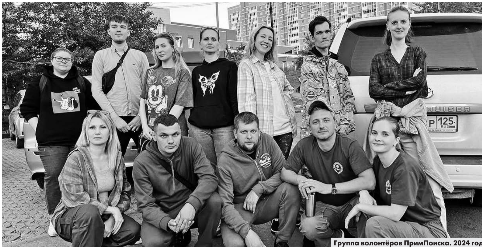
Группа волонтеров ПримПоиска. 2024 год

В это время родители с ног сбились, разыскивая дочь. Когда стали выяснять обстоятельства, хозяйка сказала, что поверила девочке на слово, а на звонки не отвечала, так как поставила телефон на беззвучный режим и легла спать.